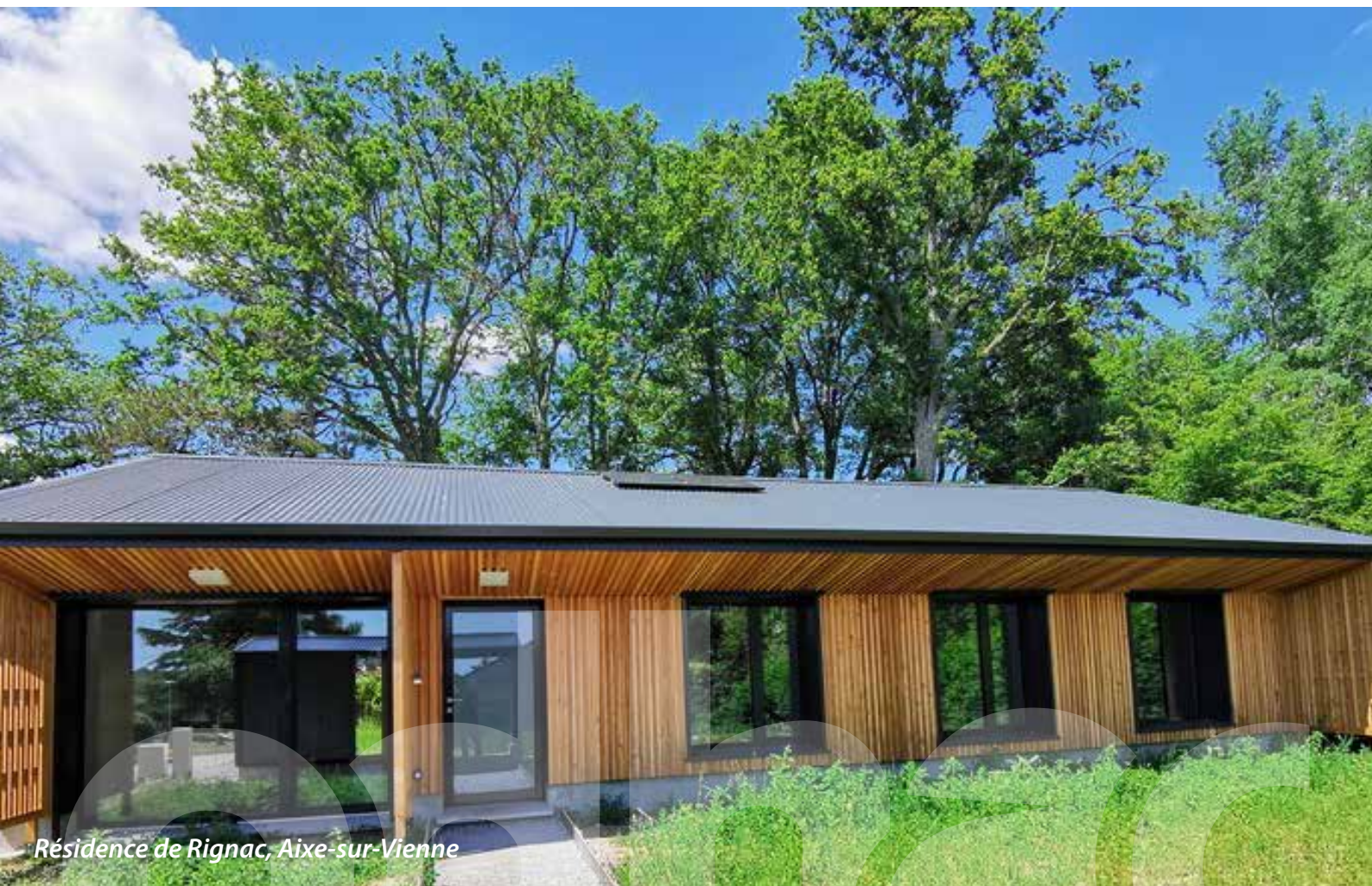
Résidence de Rignac, Aix-sur-Vienne